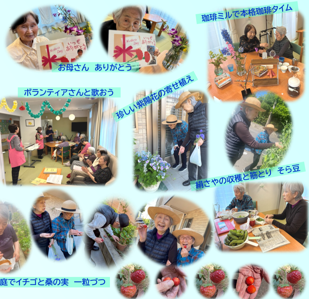
裏庭でイチゴと桑の実 一粒づつ